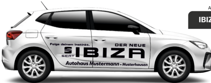
Art. Nr.: IBIZA-ECO