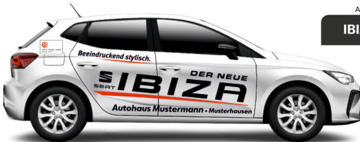
Art. Nr.: IBIZA-01