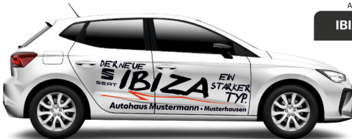
Art. Nr.: IBIZA-03