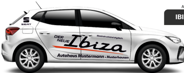
Art. Nr.: IBIZA-02